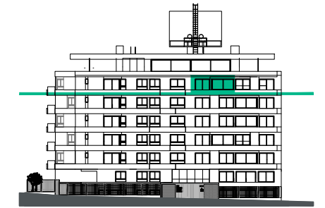
Fachada a calle Ramón Ortiz