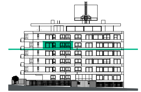
Fachada a calle Ramón Ortiz